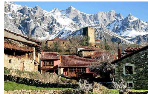
Imágenes correspondientes a la localidad de Potes, al monasterio de Santo Toribio de Liébana y a Mogrovejo

Viajar a Cantabria en verano es una maravilla. El clima es estupendo, los paisajes, espectaculares y sus pueblos, pintorescos. Por ello, os plateamos venir con nosotros a su corazón más bello. Aquí os presentamos el recorrido que haremos y los lugares que visitaremos.