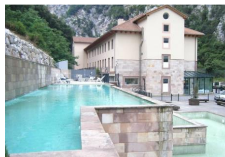
Imágenes correspondientes al Hotel Balneario de la Hermida (4*)